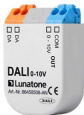
DALI to 0-10V Interface